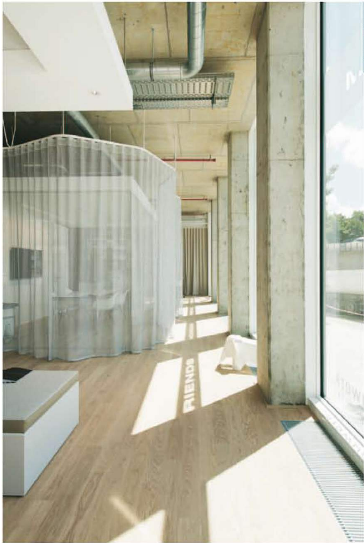
Wertige Materialien prägen das Loft