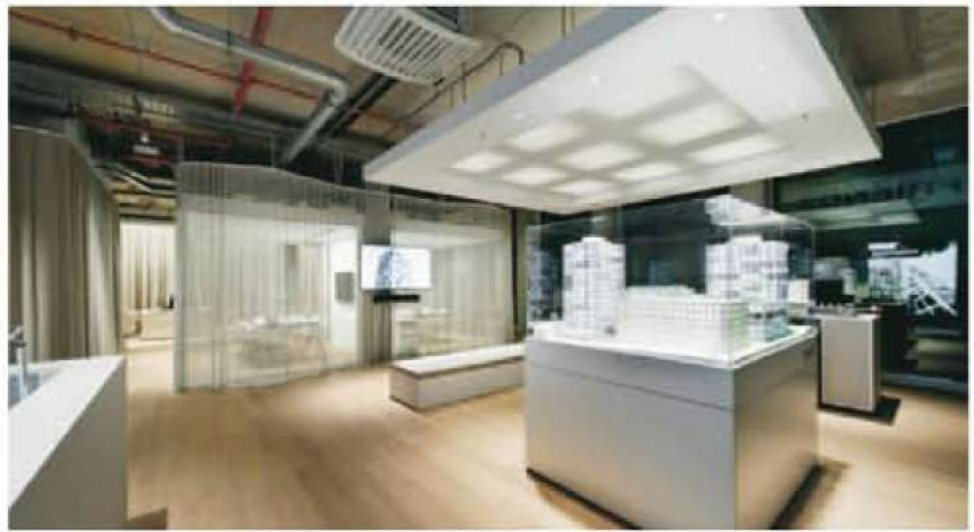
Blick in Richtung Besprecher und Backoffice