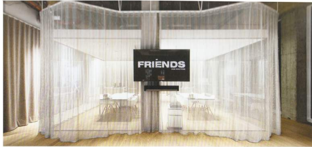
Raumskulptur bei Nacht