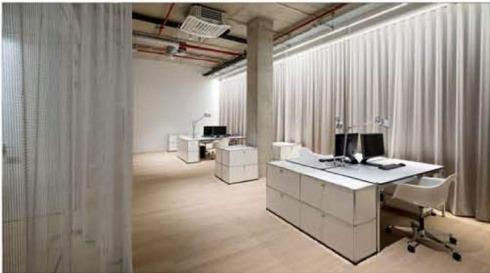
Dezente Office-Möblierung vor raumhohen Lodenvorhängen